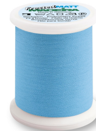
Madeira Frosted Matt