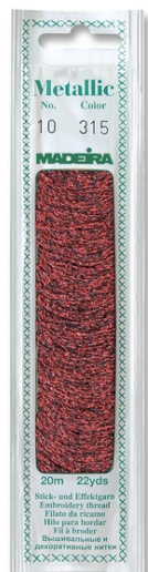
Madeira Metallic za ročno vezenje

Prejela sem odziv naše uporabnice sukancev Madeira: