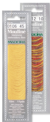
Madeira Mouliné Sticktwist za ročno vezenje